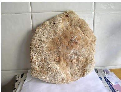
“Bola” o “Torta”