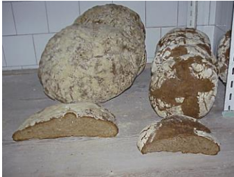
“Bolo” u “Hogaza”